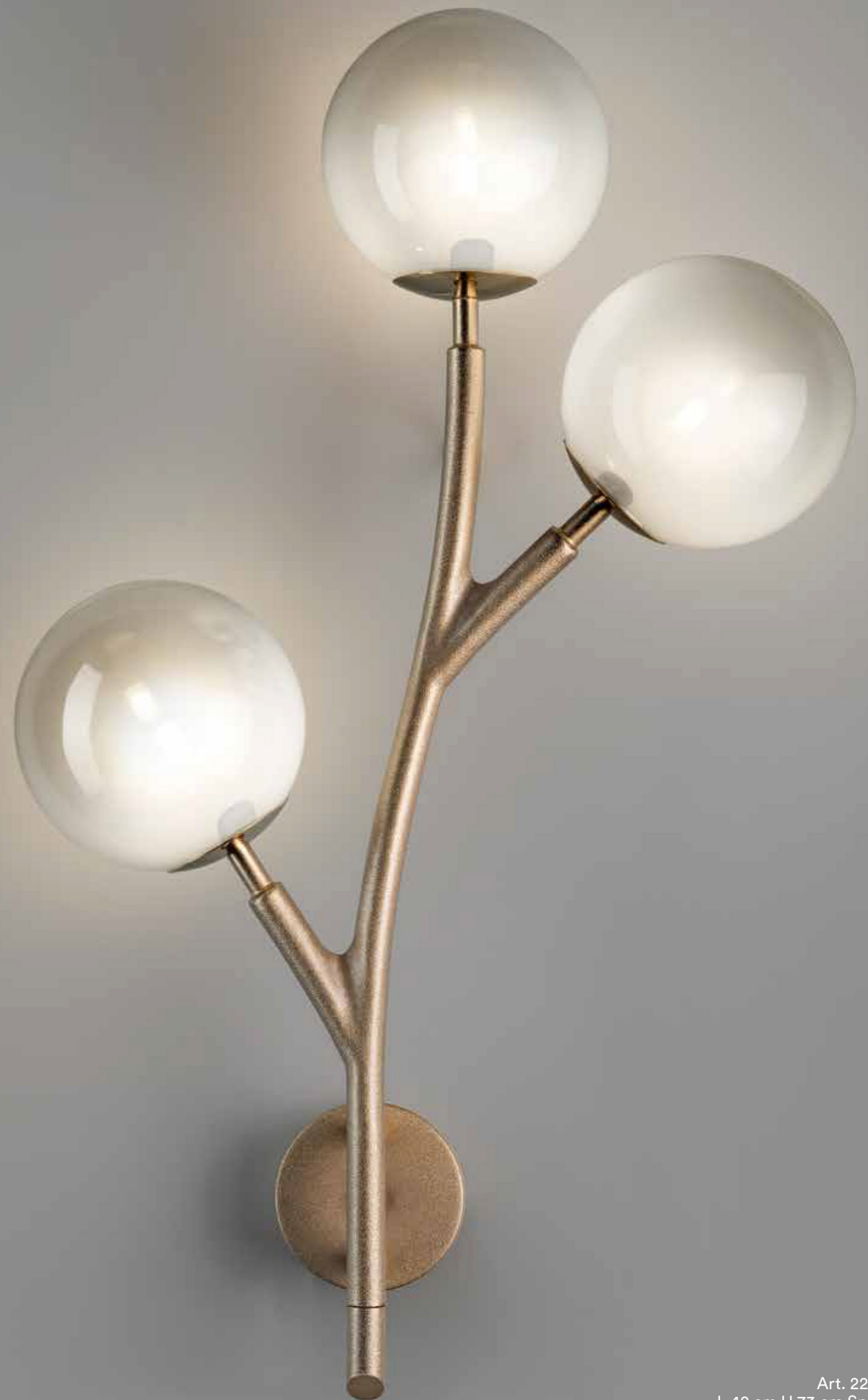
Art. 2248/A3 L 42 cm H 73 cm Sp 16 cm 3 x G9 x Led (Kg 6)