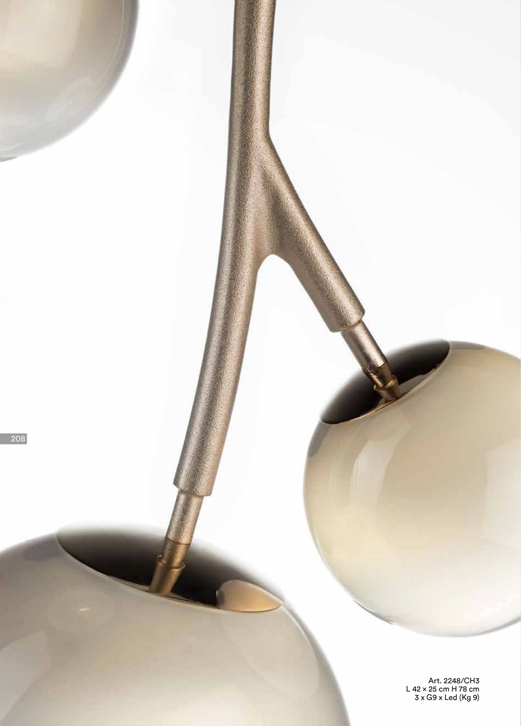
Art. 2248/CH3 L 42 x 25 cm H 78 cm 3 x G9 x Led (Kg 9)