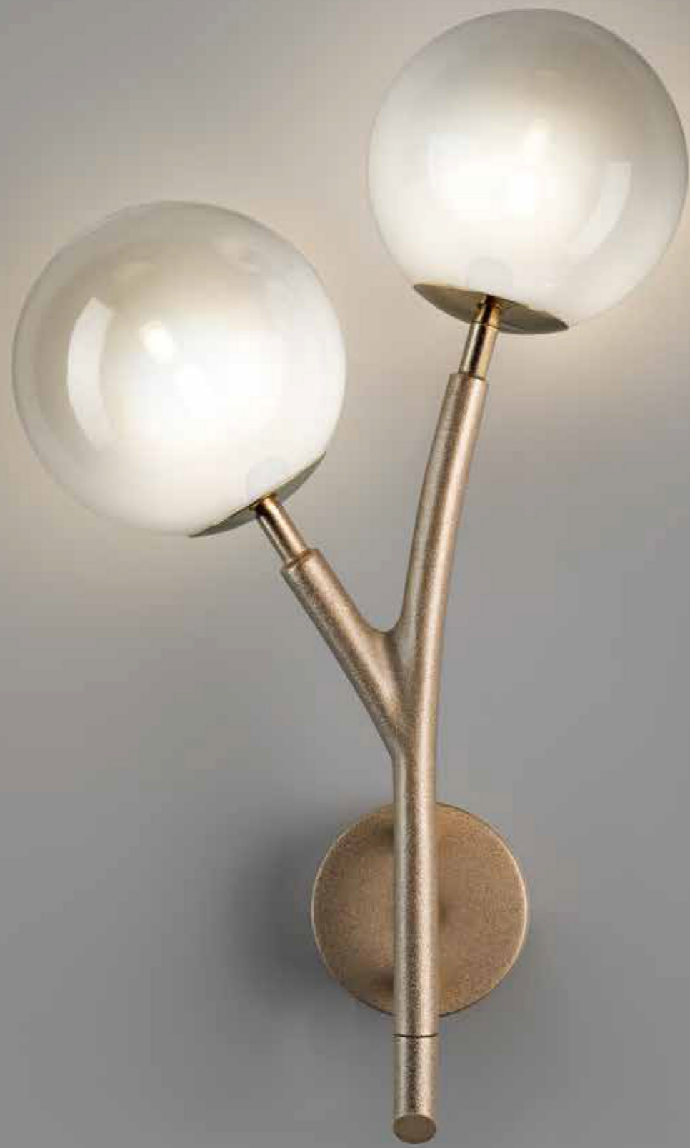
Art. 2248/A2 L 30 cm H 53 cm Sp 16 cm 2 x G9 x Led (Kg 4)